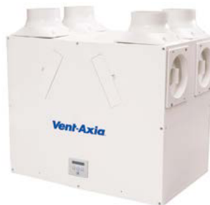
Kinetic B Plus